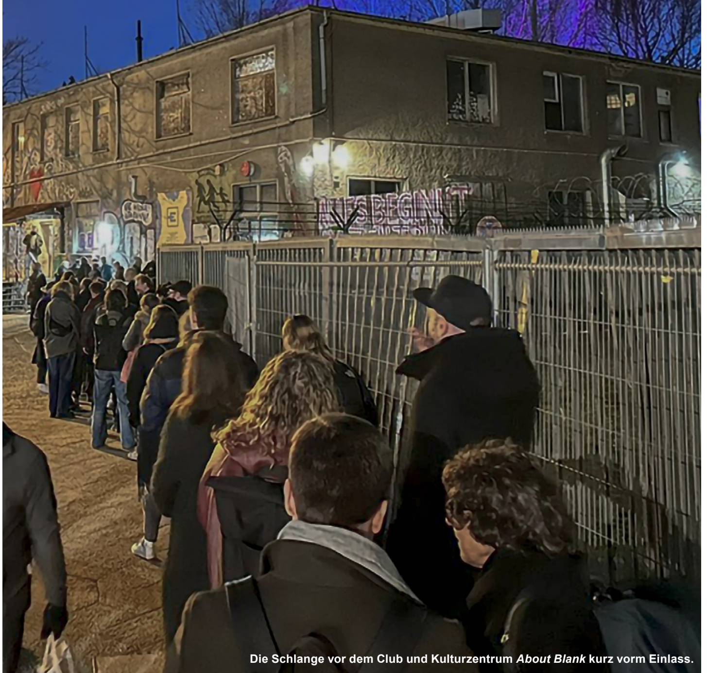
Die Schlange vor dem Club und Kulturzentrum About Blank kurz vorm Einlass.

Ein fünfteiliger Podcast der Gedenk- und Bildungsstätte Haus der Wannsee-Konferenz zu Antisemitismus an Bildungs- und Kulturorten, wurde am 26. Februar 2026 im Club und Kulturzentrum About Blank vorgestellt.