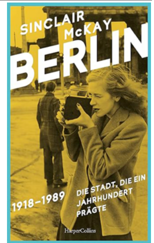
Hamburg: HarperCollins 2023, 28 Euro (Original: London 2022)