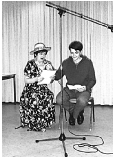
Alt und Jung proben einen Auftritt

Staat und Politik können wenig dazu beitragen, vielmehr gilt: „Ob sich Alt und Jung mit Respekt begegnen, sich als Last oder als Bereicherung definieren, entscheidet sich im alltäglichen Umgang.“ Das „Nebeneinander“ der Generationen fördert und festigt jedoch die gegenseitigen Vorurteile und Klischees; dass sich Alt und Jung überhaupt begegnen, bedarf also eines Anstoßes und einer Moderation.