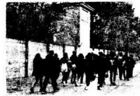
Junge Menschen besuchen das frühere KZ Sachsenhausen

„In Ergänzung zu den üblichen Schulklassenfahrten wollen