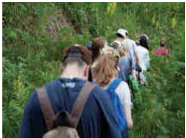
Jugendliche erwandern die Wege der Partisanen