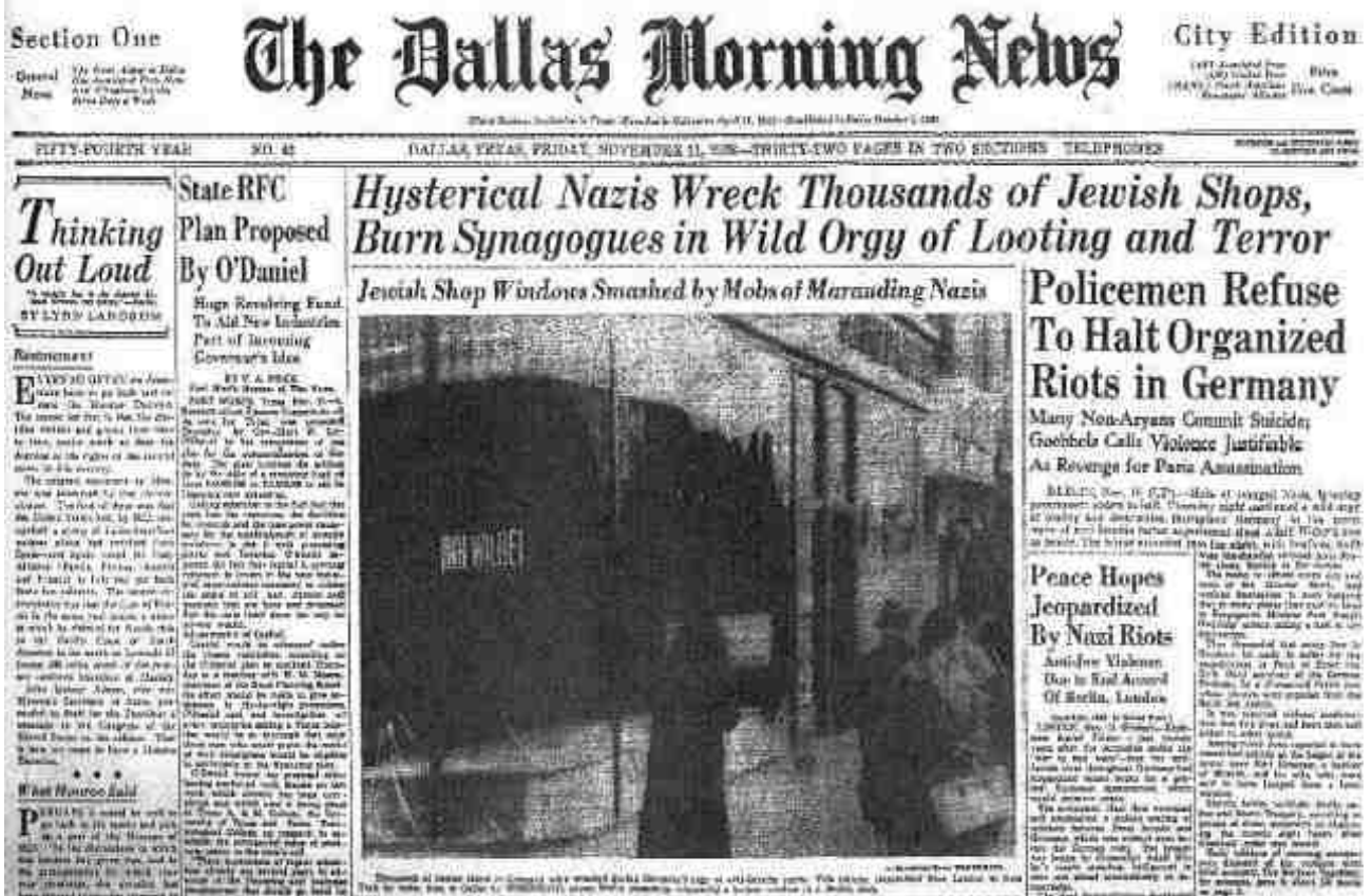
„Hysterische Nazis demolieren Tausende von jüdischen Geschäften, brennen Synagogen nieder in wilder Plünderungs- und Terrororgie. Polizei schreitet nicht gegen organisierte Krawalle ein.“

Wir organisieren und vernetzen Erinnerungsarbeit ❖ November 2014