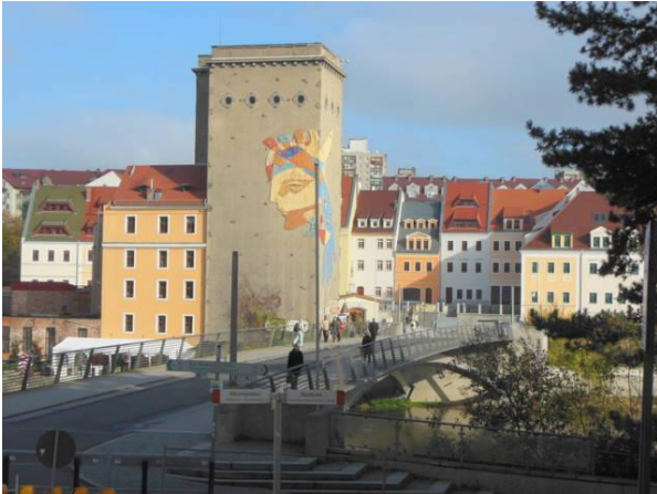
Blick auf die Altstadtbrücke und Zgorzelc

Brücken spielen in Städten, durch die ein Fluss fließt, eine wichtige Rolle; verbinden sie doch zwei oder mehrere Stadtteile miteinander. Noch wichtiger können Brücken sein, wenn sie zwei Ansiedlungen verknüpfen. Beispiele gibt es einige in Deutschland. Brücken sind unerlässlich an einem Grenzfluss, wenn sich zwei Städte gegenüber liegen, wie zum Beispiel an Oder und Neiße.